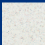
Mineralweiß Best.-Nr. 55